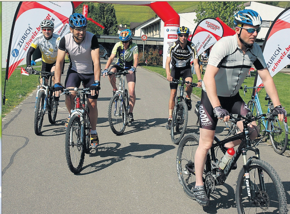
HAT EINE IMMER GRÖßERE BEDEUTUNG Der Erwachsenensport – vielfältig, flexibel, individuell und doch ein soziales Erlebnis.